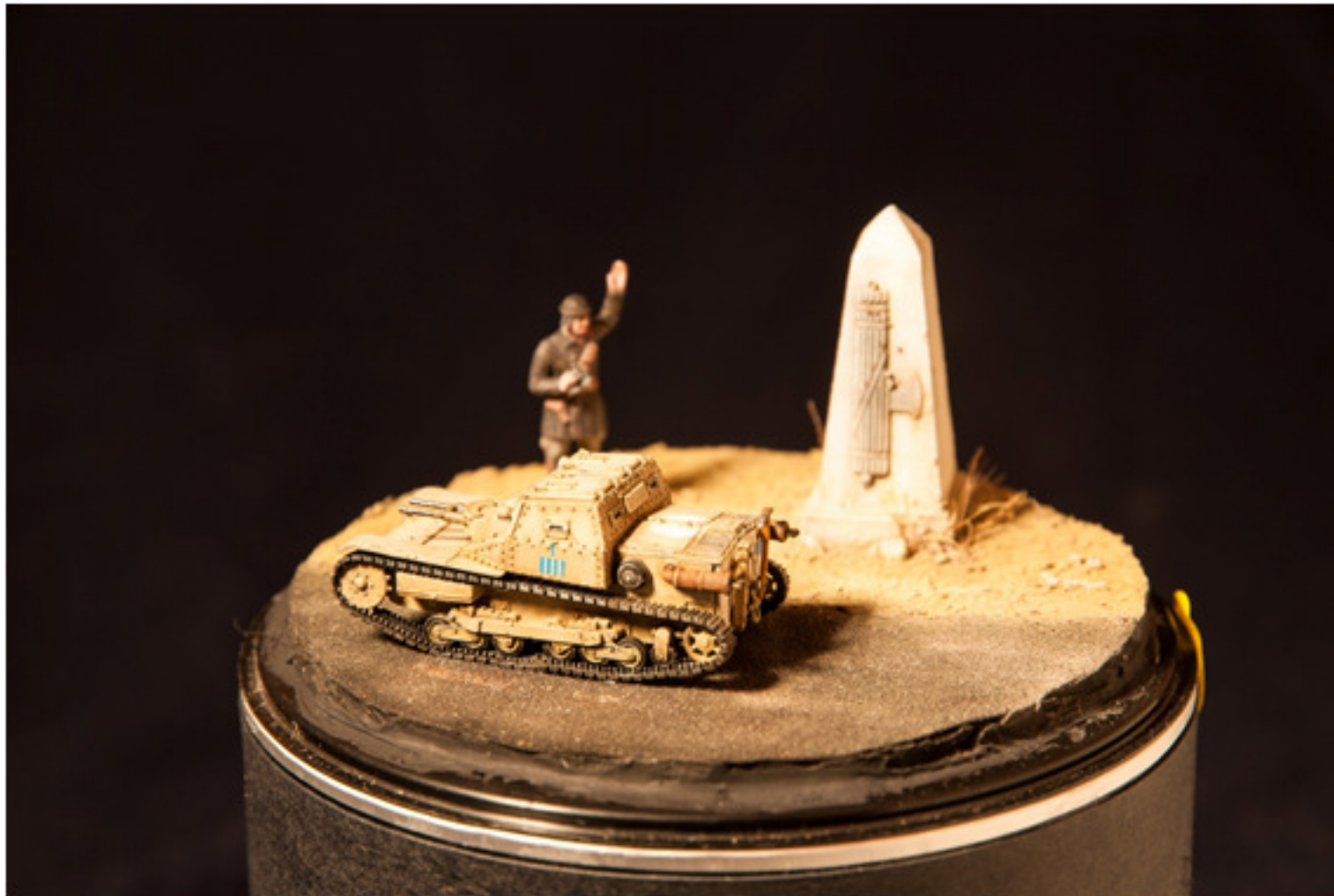
Mario Bentivoglio : CV 35 sulle strade dell'impero