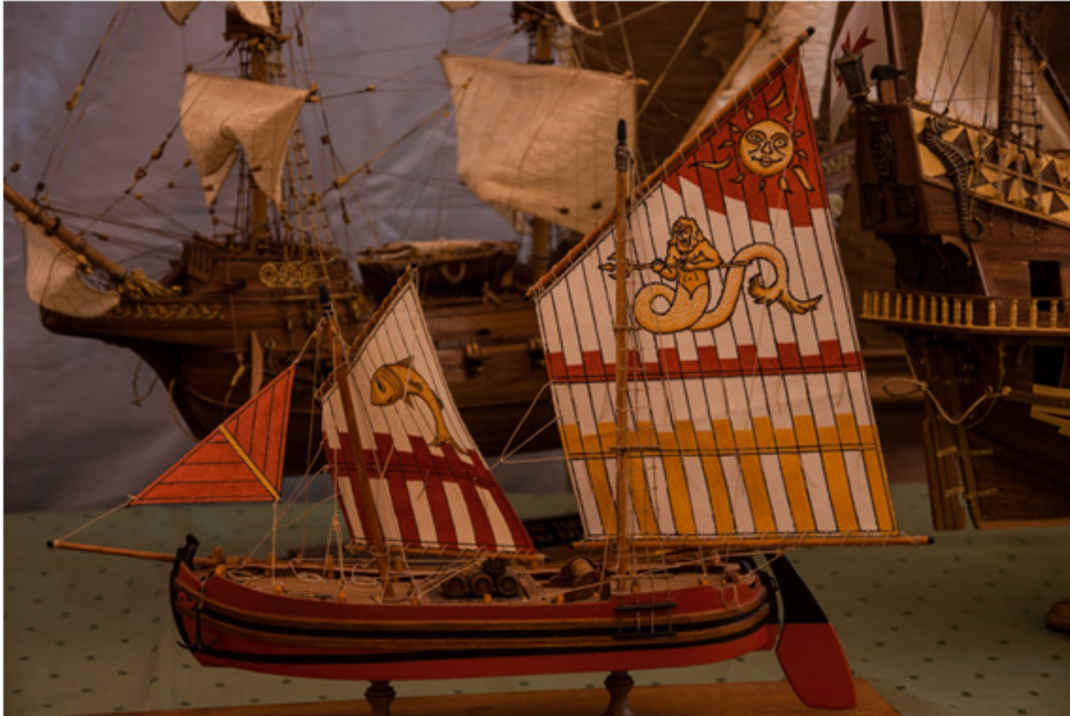
Riccardo Brunetti : Trabaccolo Adriatico 1800