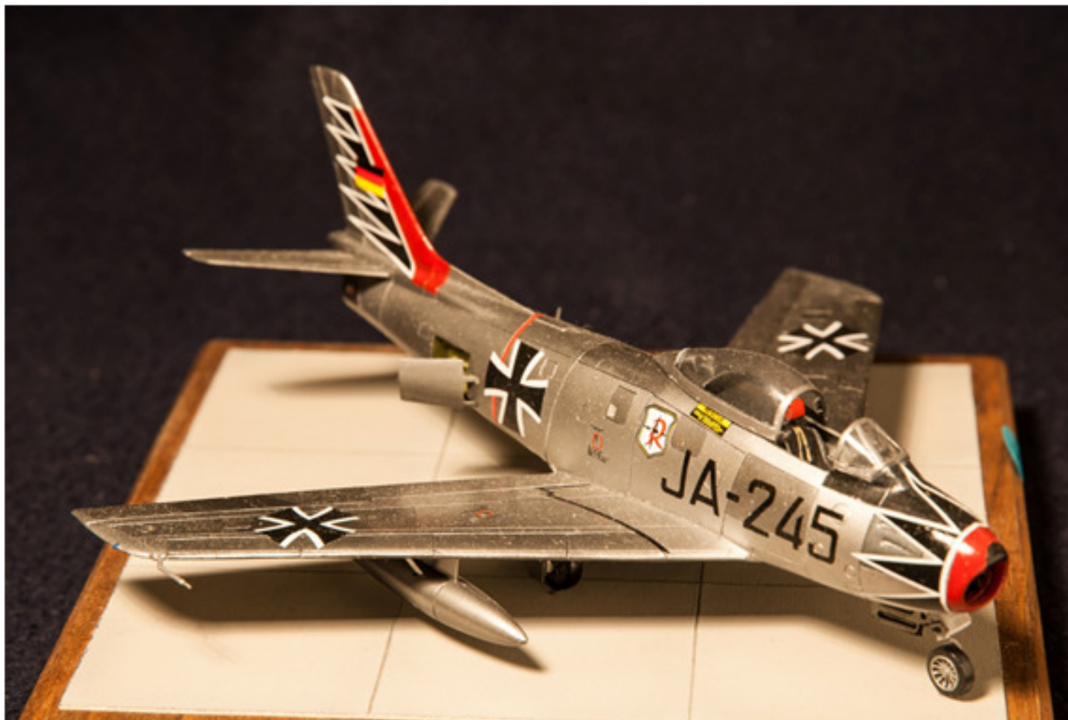
Giuseppe Musso : F86 Sabre Lufthaffe 1:72