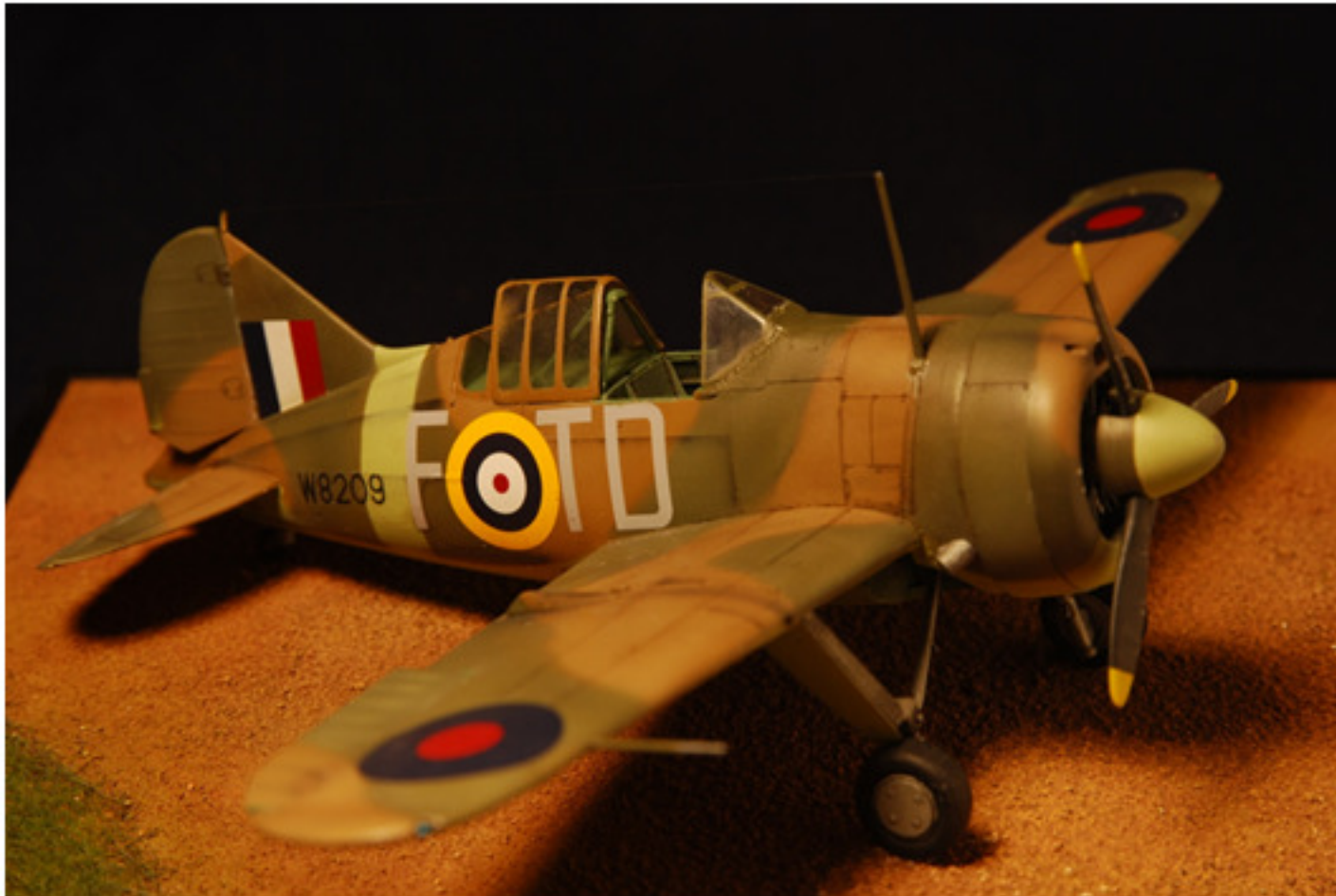
Luciano Palmieri : MB-339 buffalo