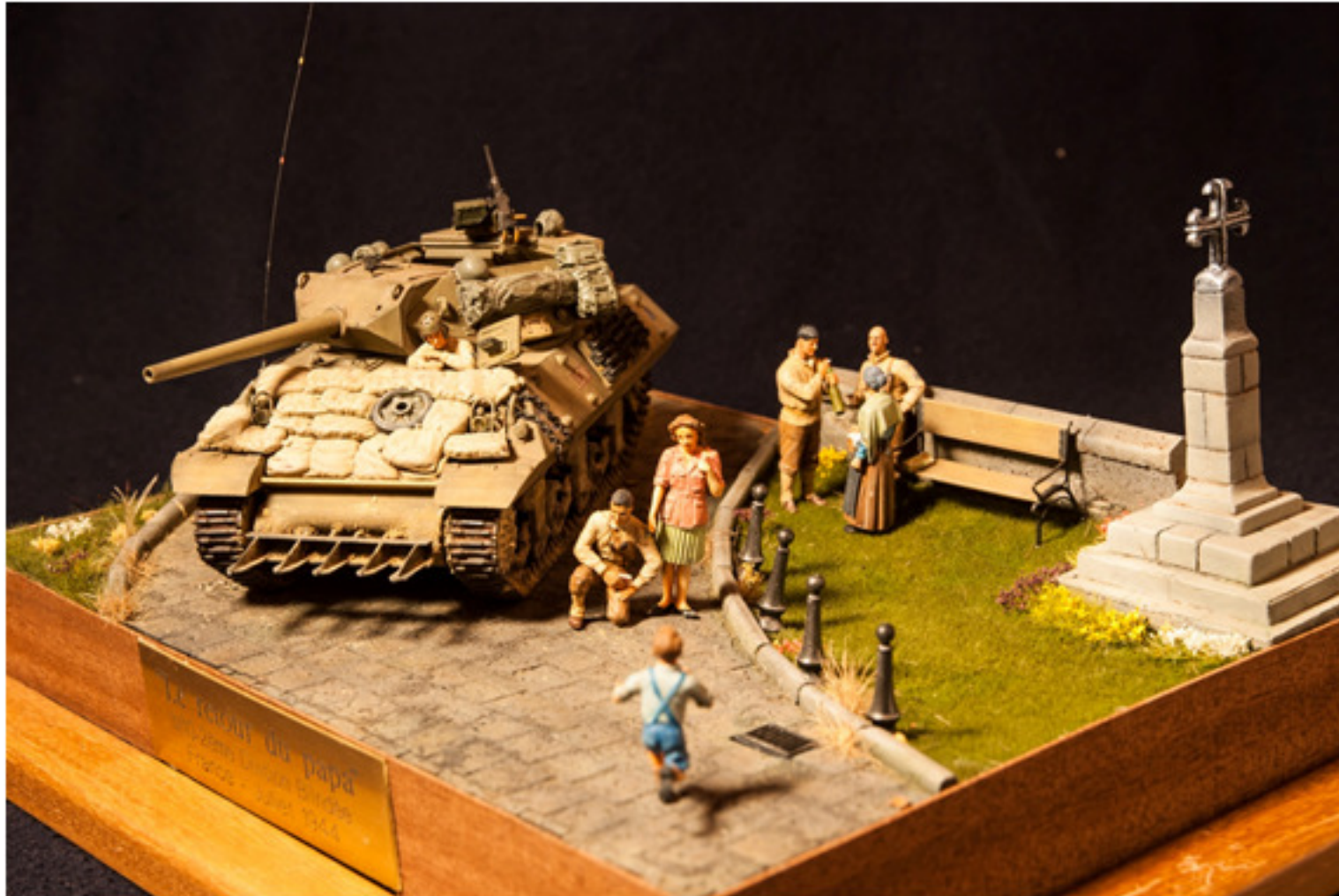
Andrea Sala : Le rotour du Papà (M10 destroyer)