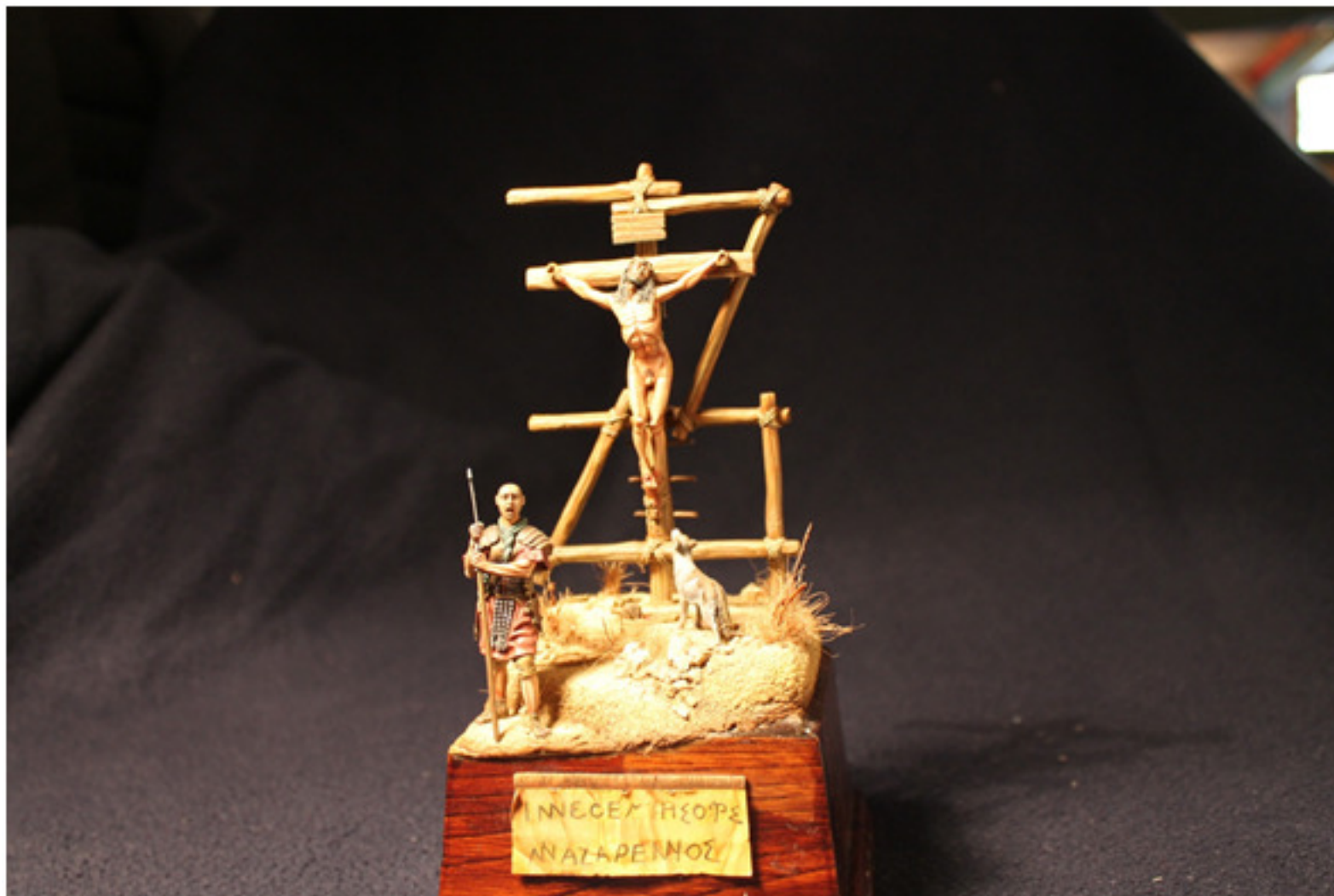
Renzo Cabras : Crocifissione