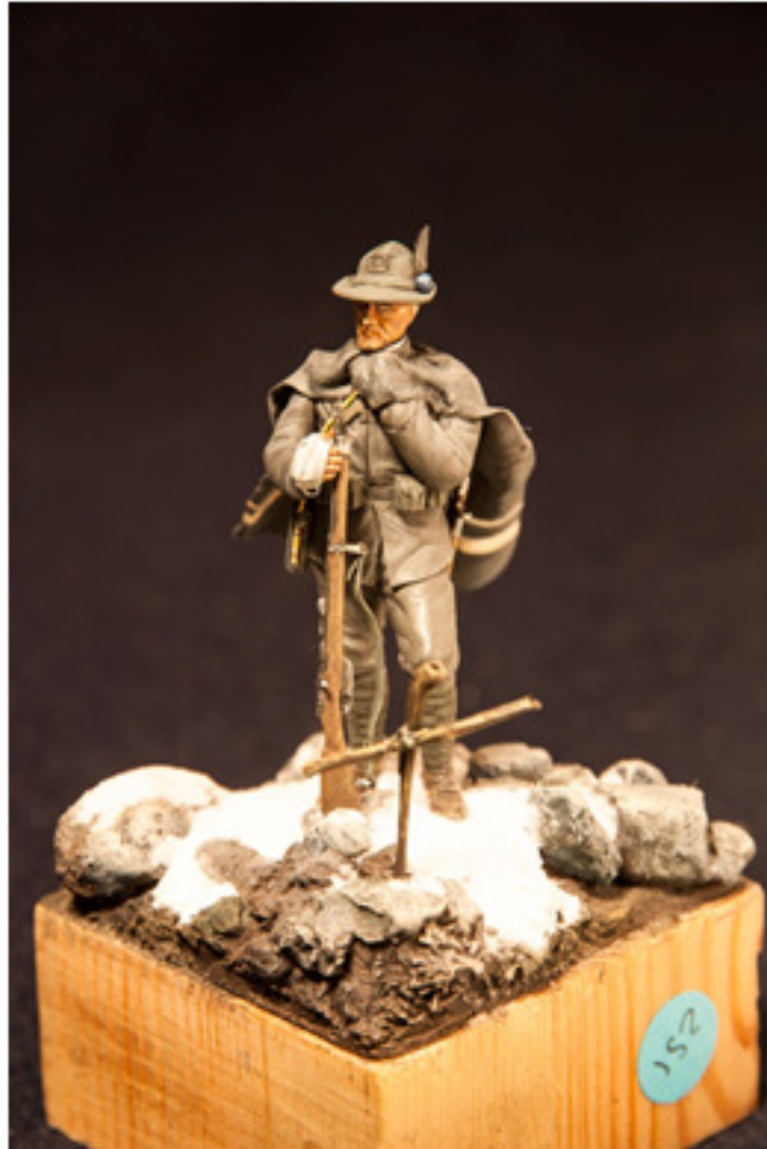
Claudio Galetto : Alpino