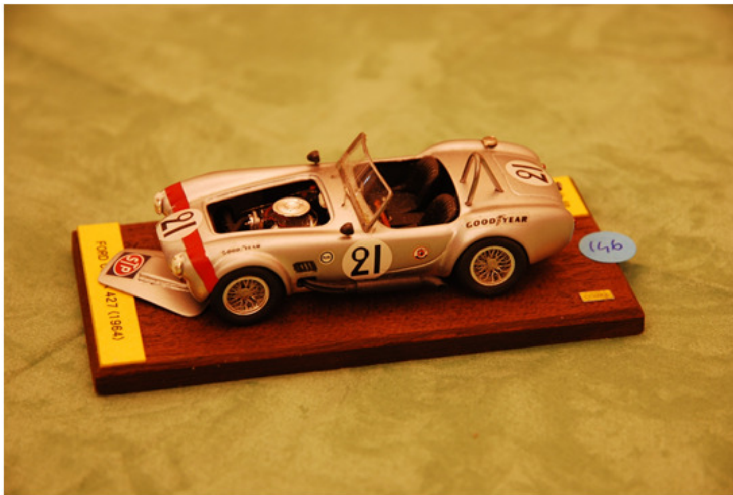
Giuseppe Titone : Ford Cobra 427