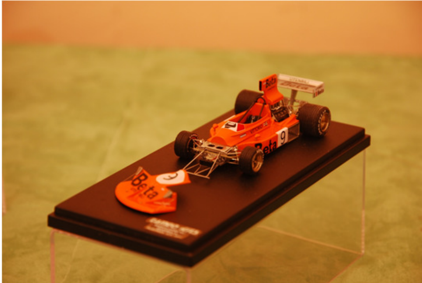
Sergio Albano : March 751