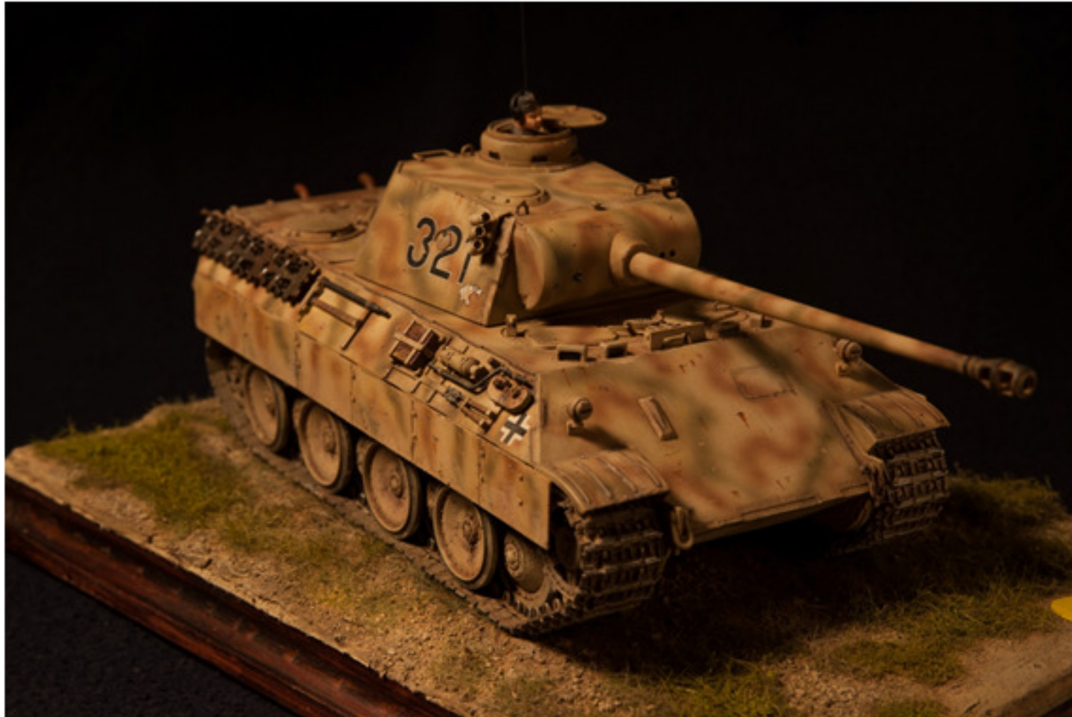
Diego Vicario : Panther Ausf D