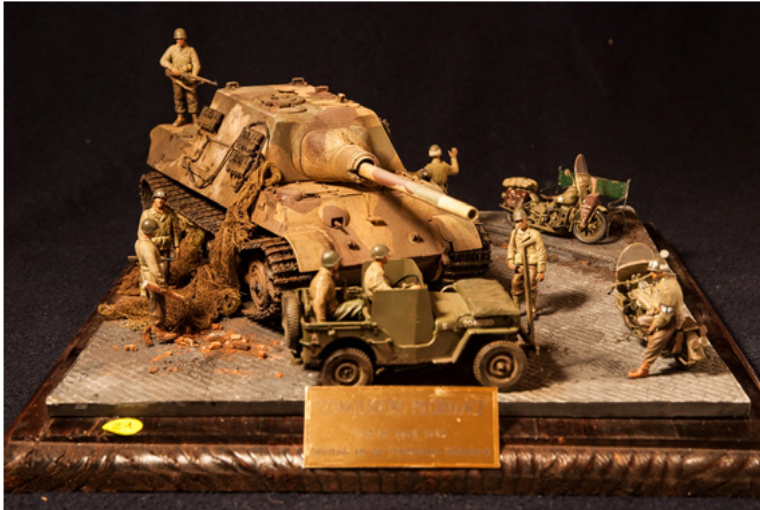
Roberto Germiniani : Conquerors pilgrimage