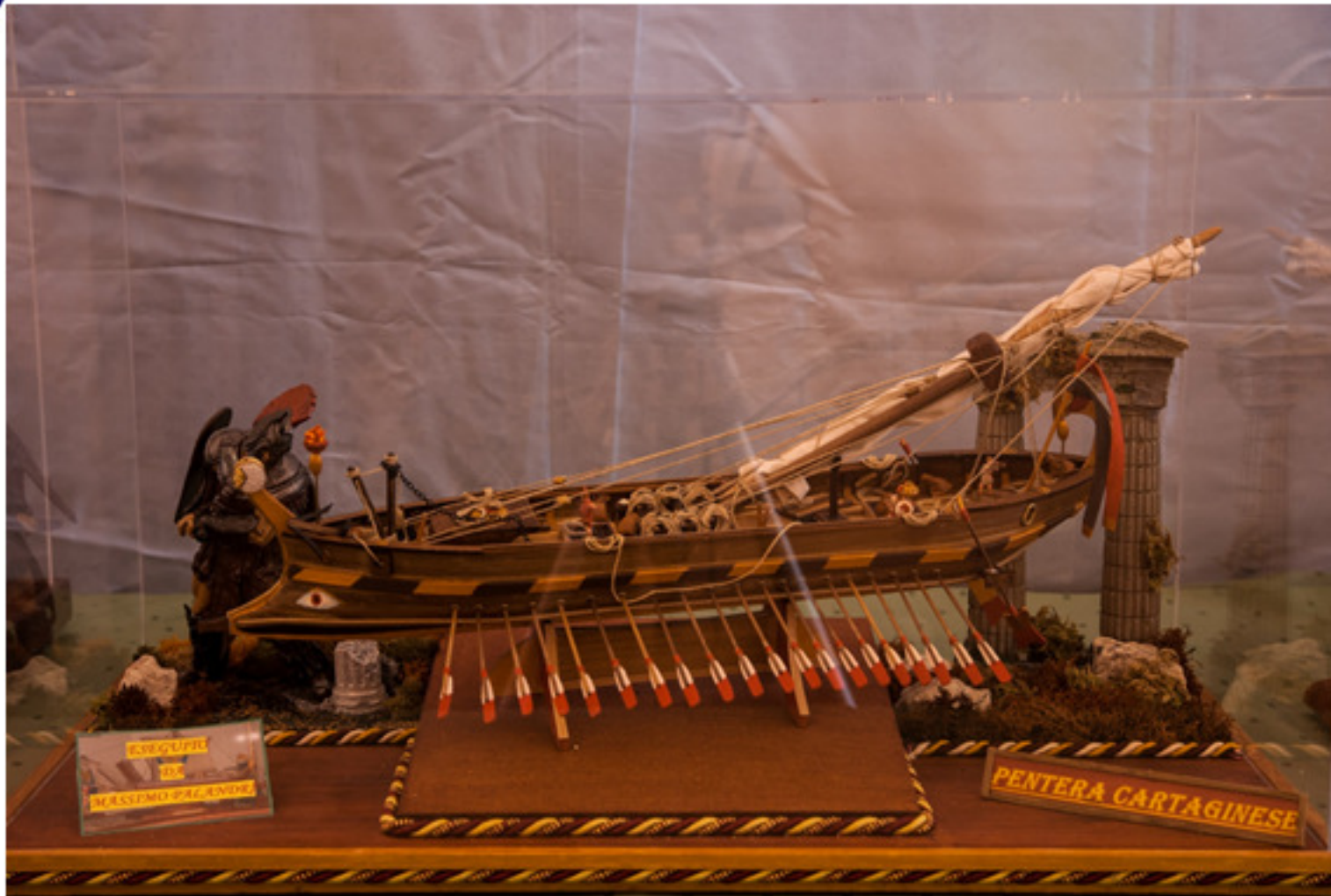
Massimo Palandri : Pentere Cartaginese