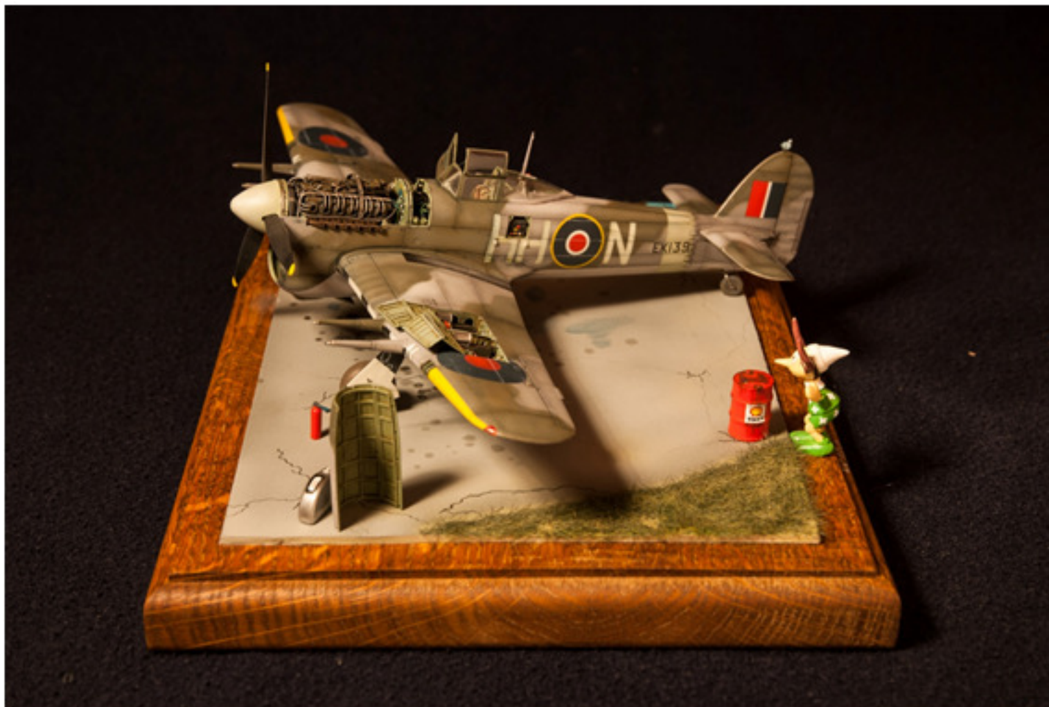
Valter Vaudagna : Typhoon MK 1B