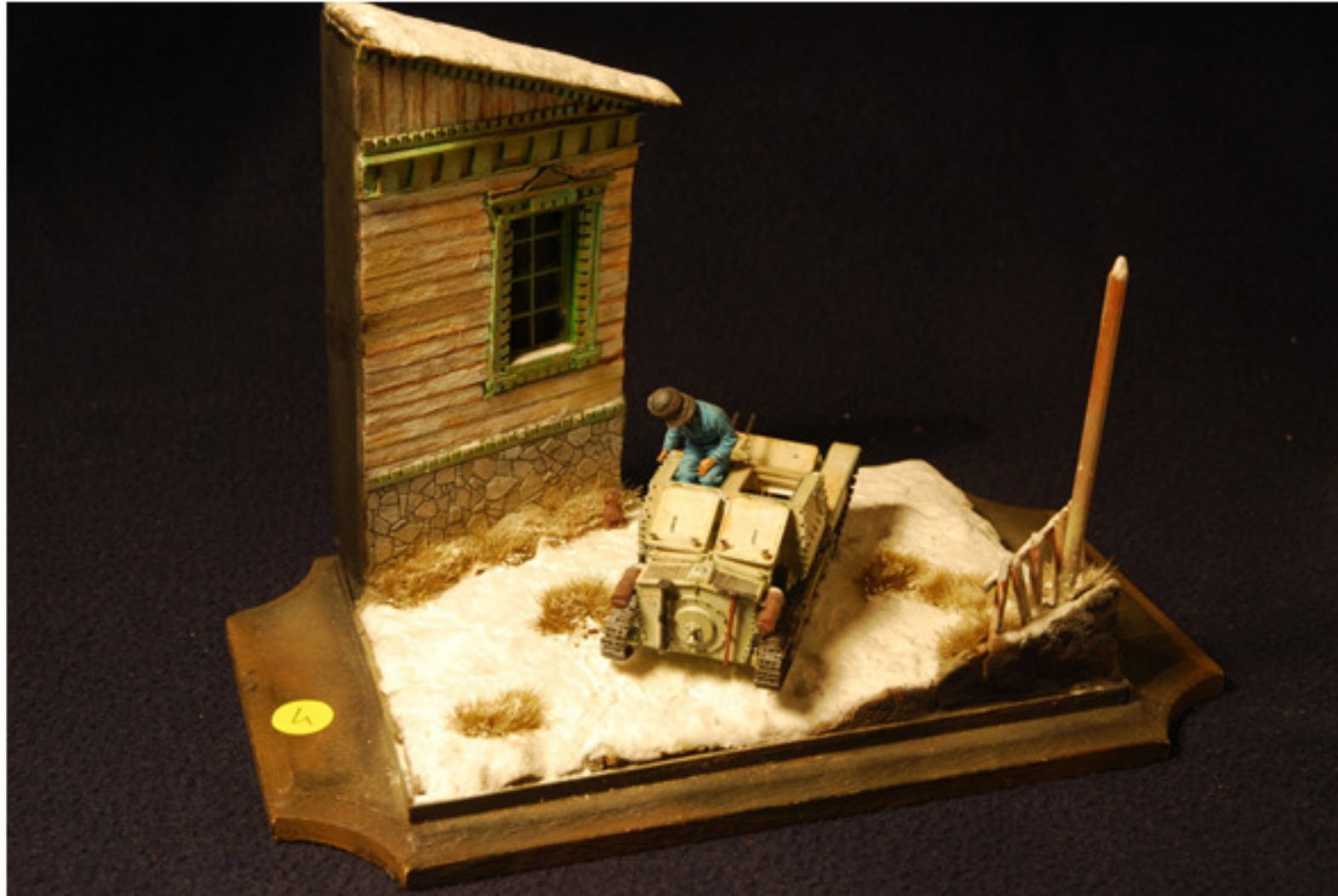
Marco Bottoni : Carro leggero L3/35