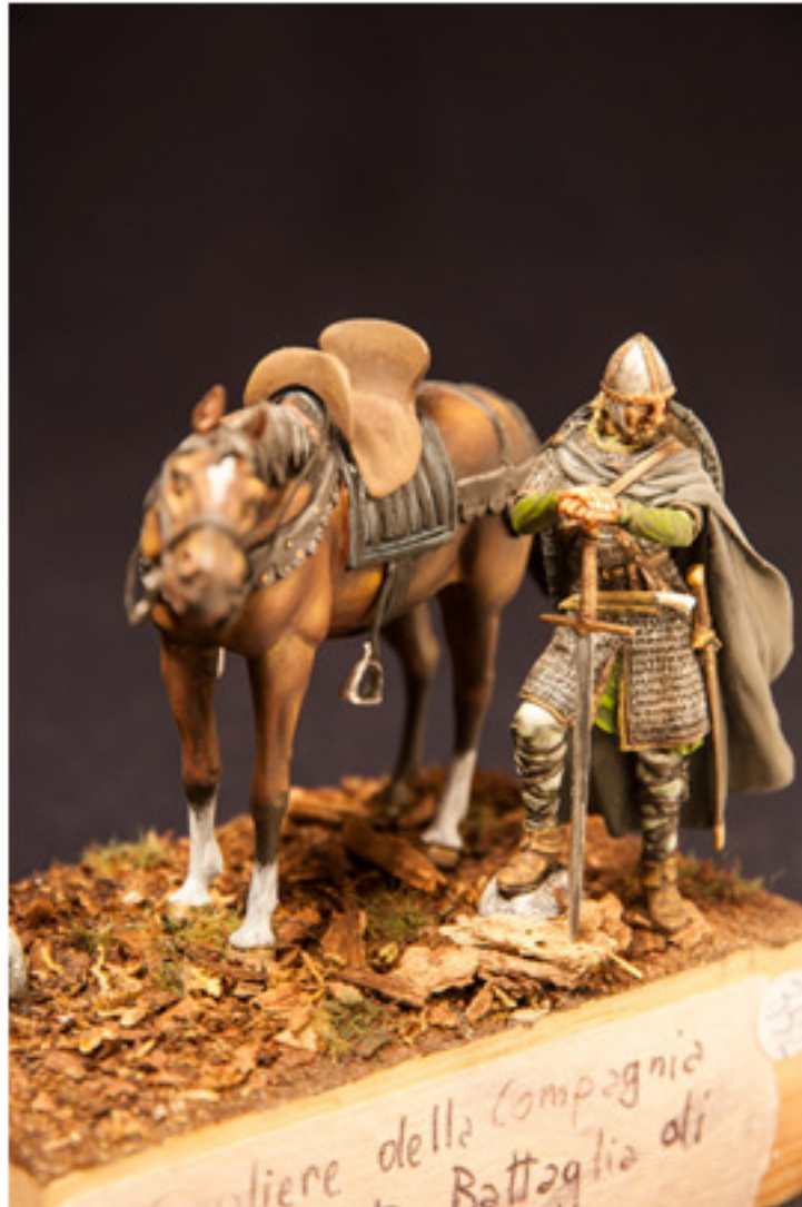
Claudio Galetto : Cavaliere compagnia della morte