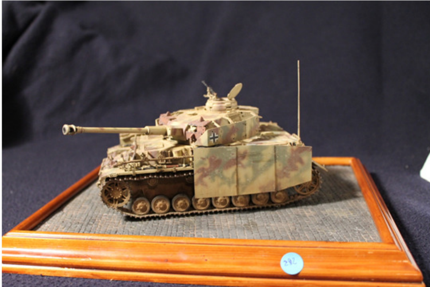
Rocco Maiocchi : Panzer IV