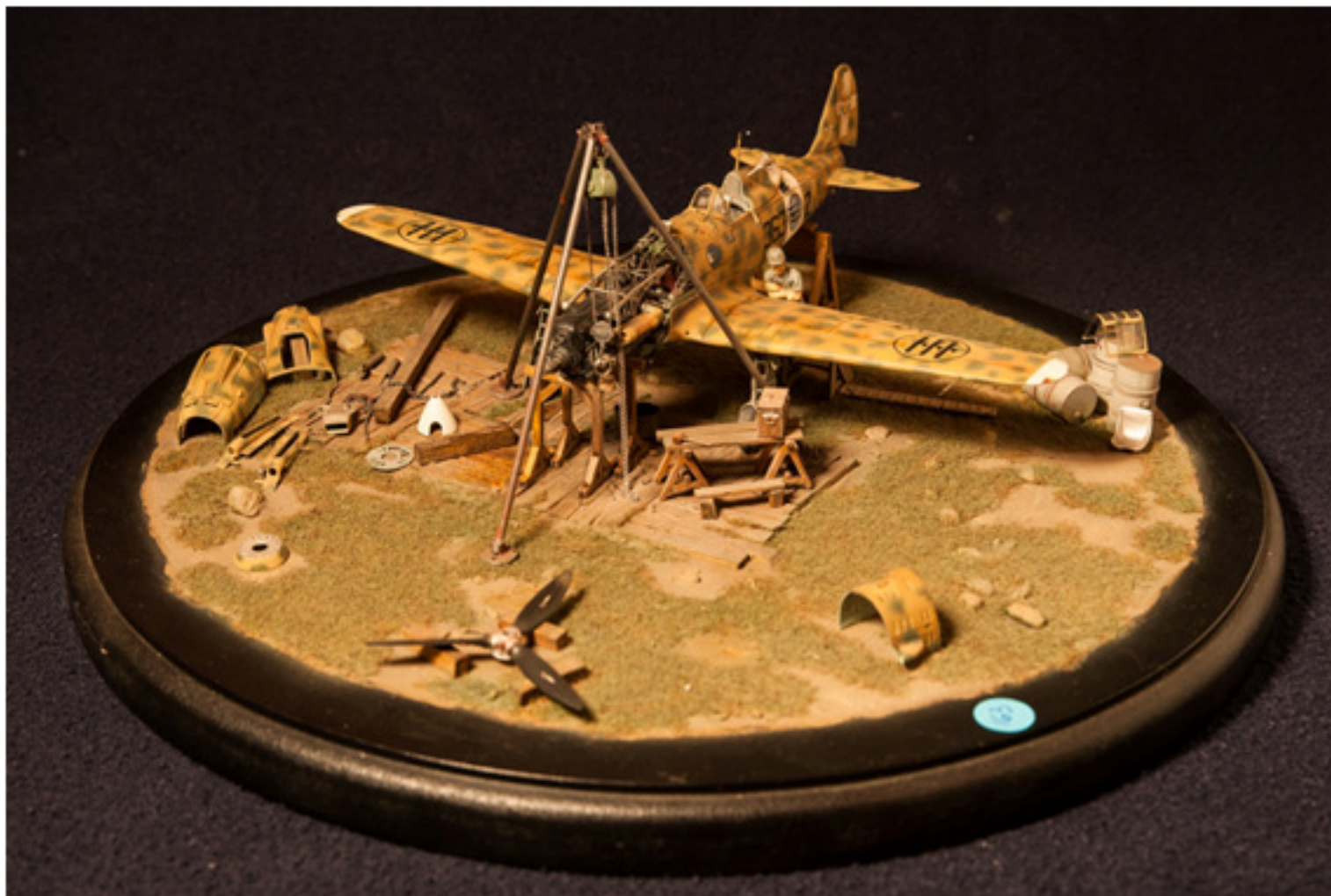
Valter Vaudagna : macchi 202 Folgore