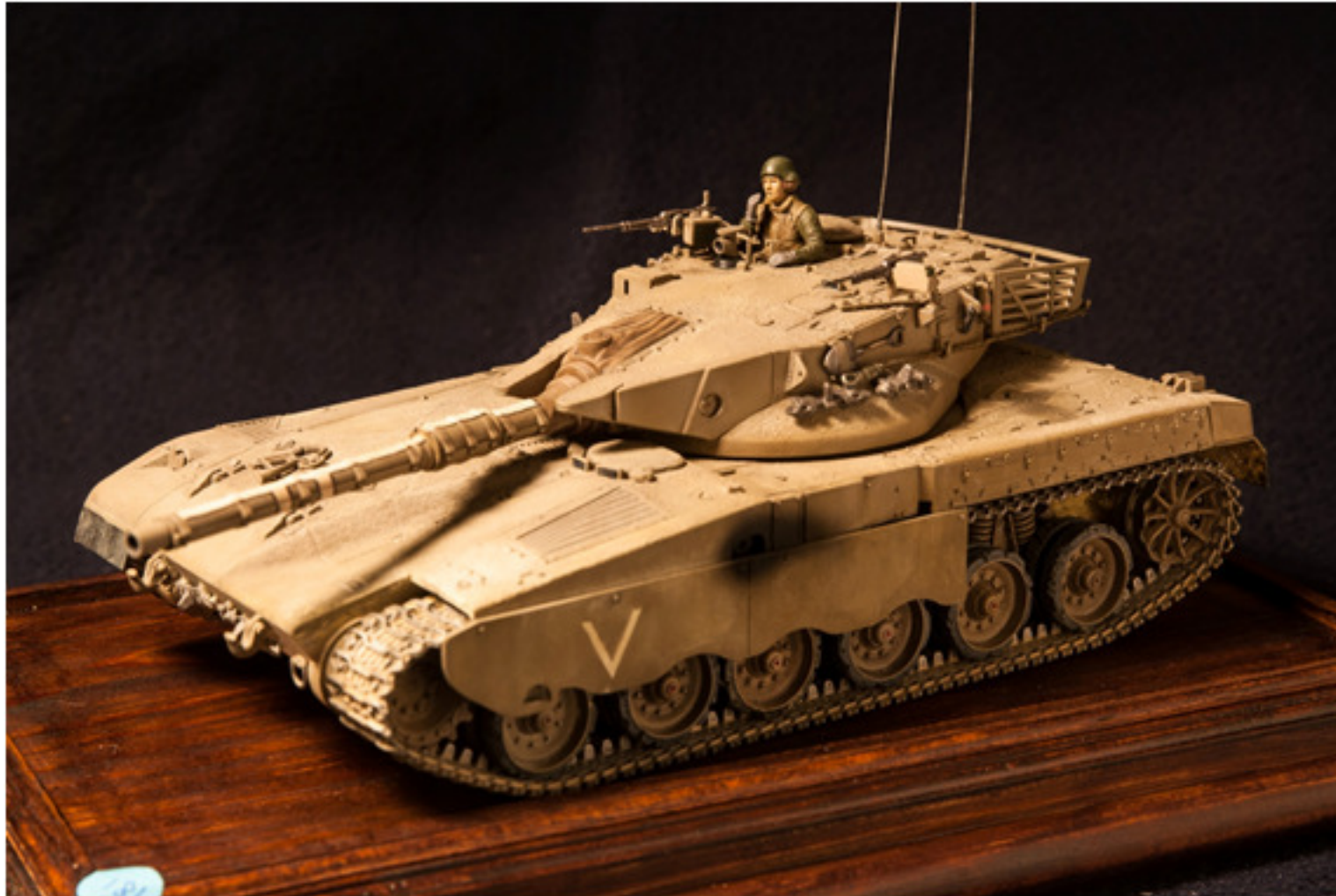
Marco Sogliani : IDF Merkava Mk.I