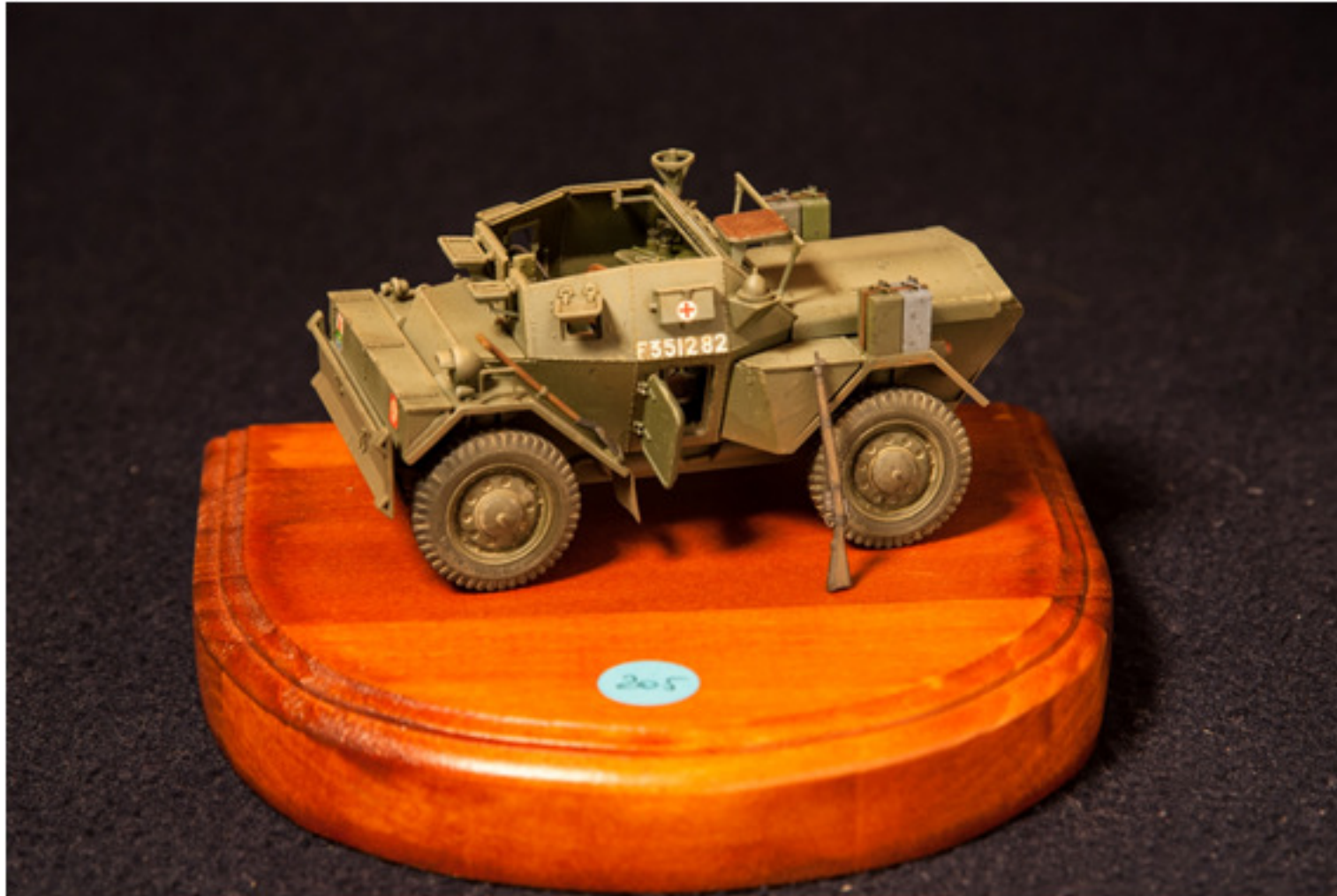
Gilberto Rapelli : Dingo MKIII