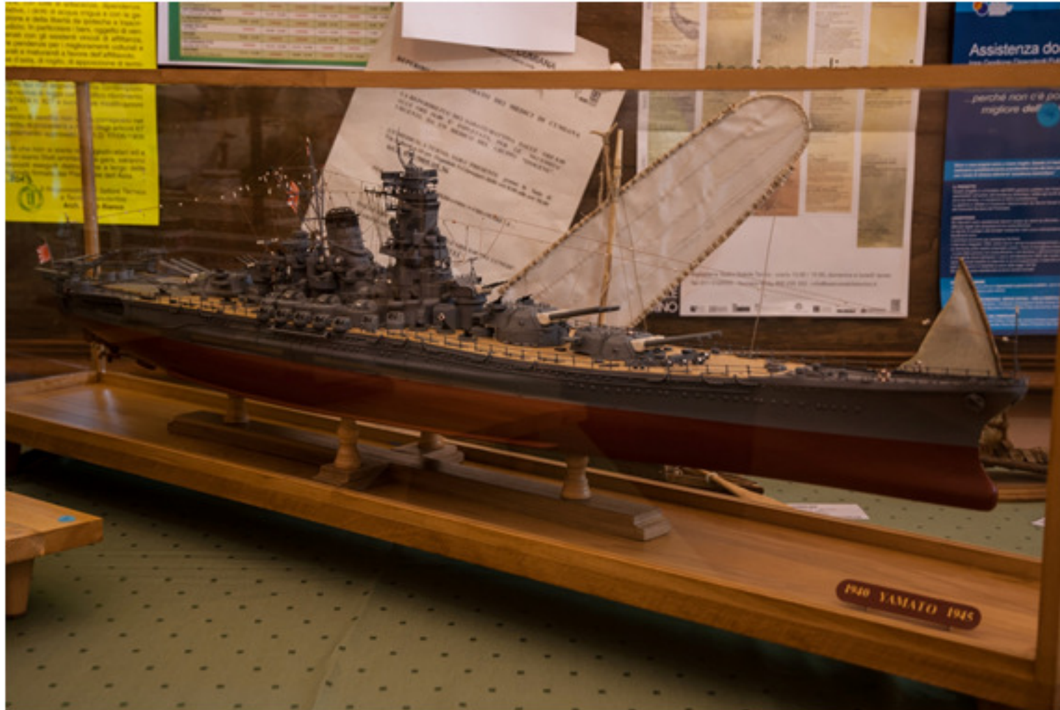
Salvatore Saitta : Corazzata Yamato