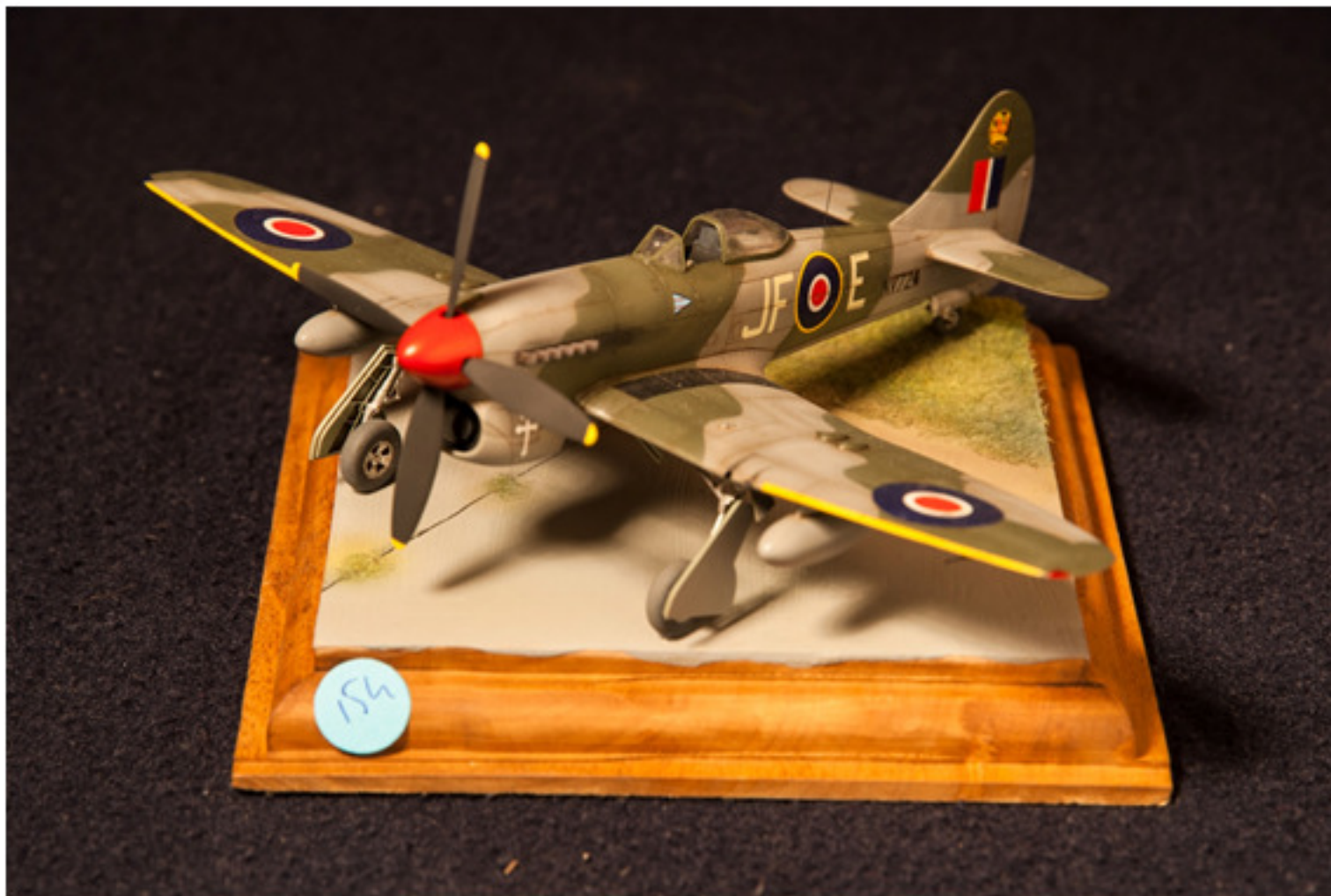
Sergio Albano : Tempest MK V