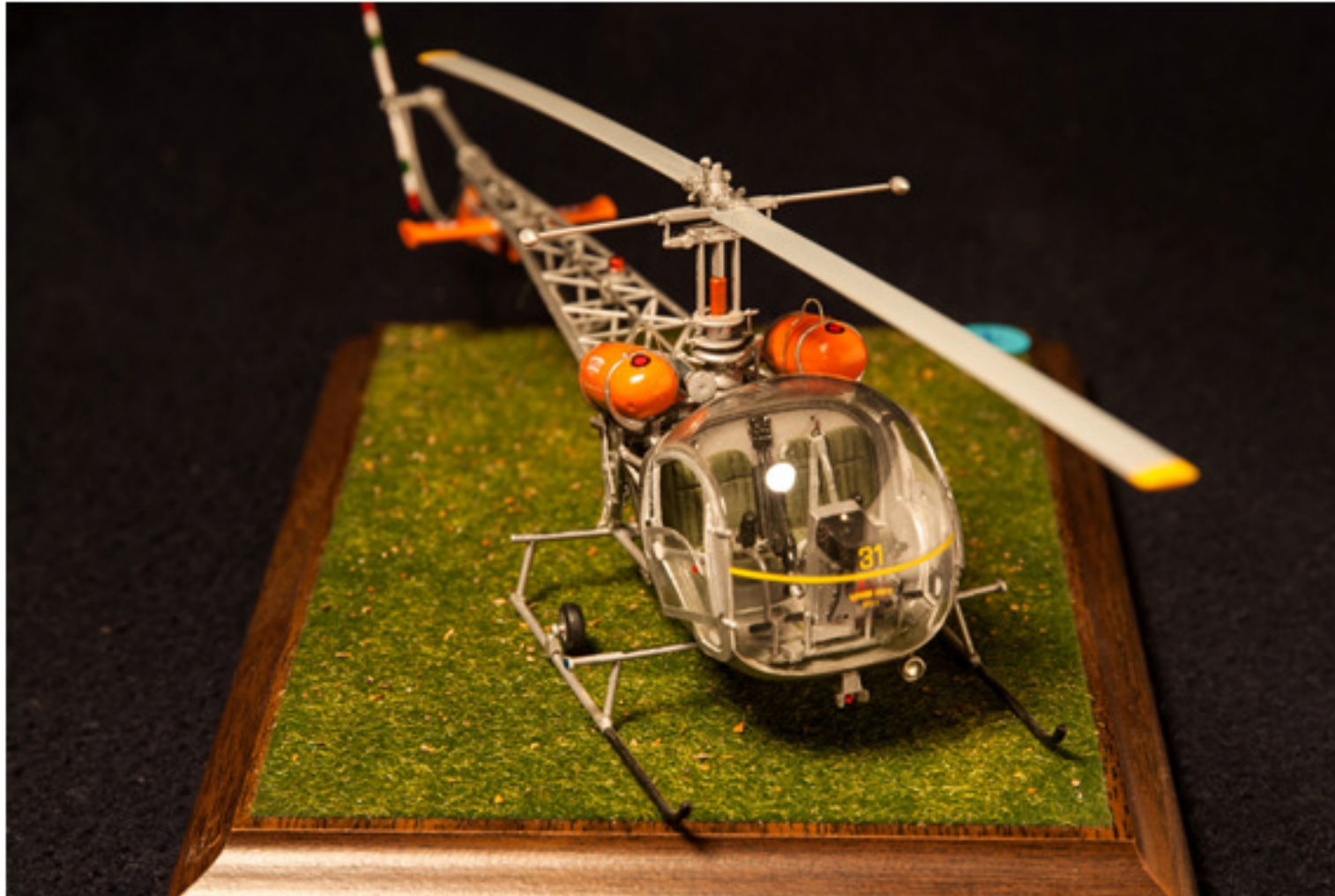
Silvano Bianco : Agusta bell AB 47G AMP