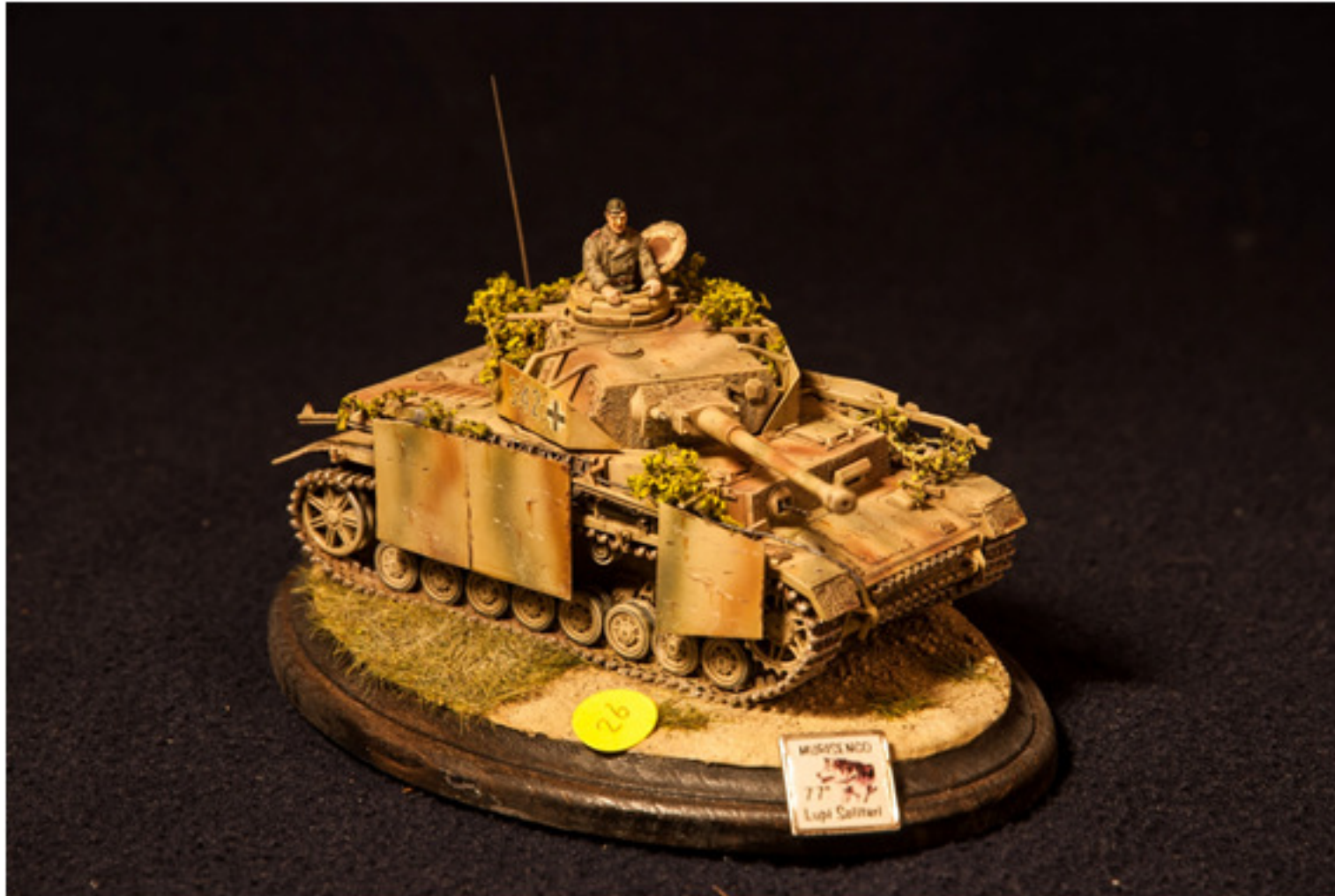
Diego Vicario : Panzer IV Ausf