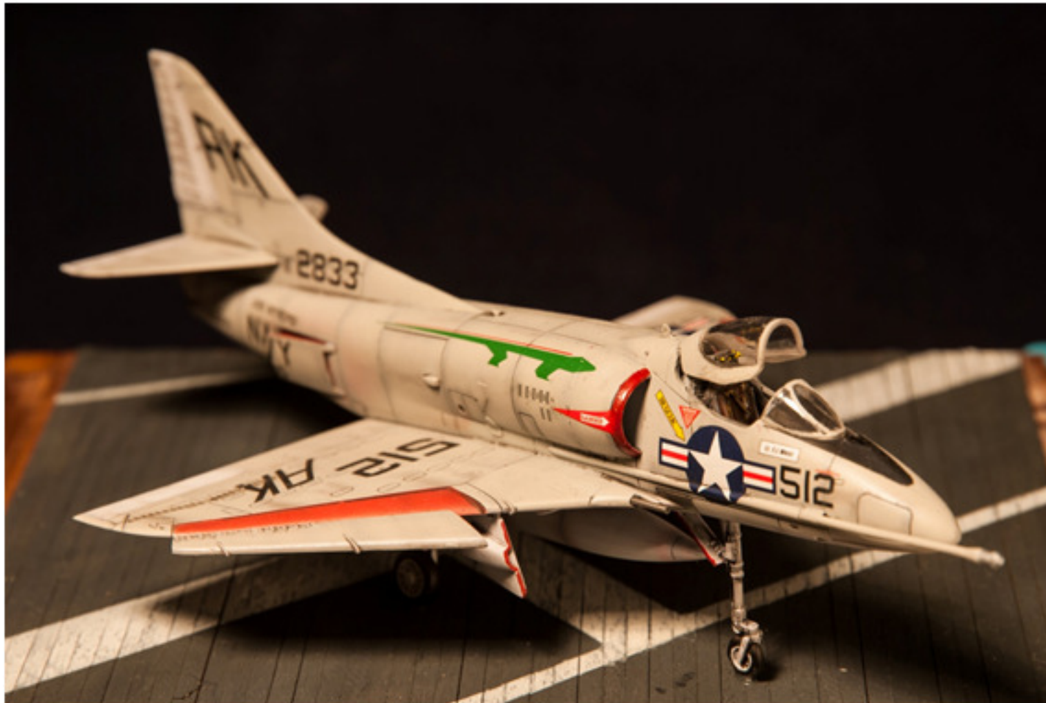
Fulvio Forestello : A4 /B 1:72