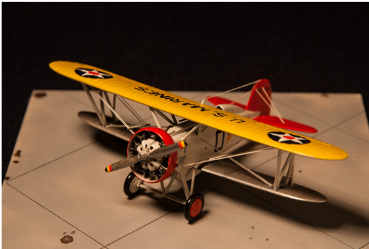
Riccardo Brunetti : Boeing F4B-4 1:72