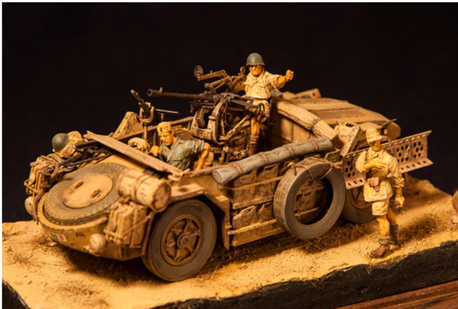
Danilo Picco : AS 42 Sahariana