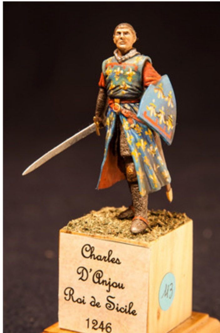
Francesco Sbarile : Charles d'Anjou