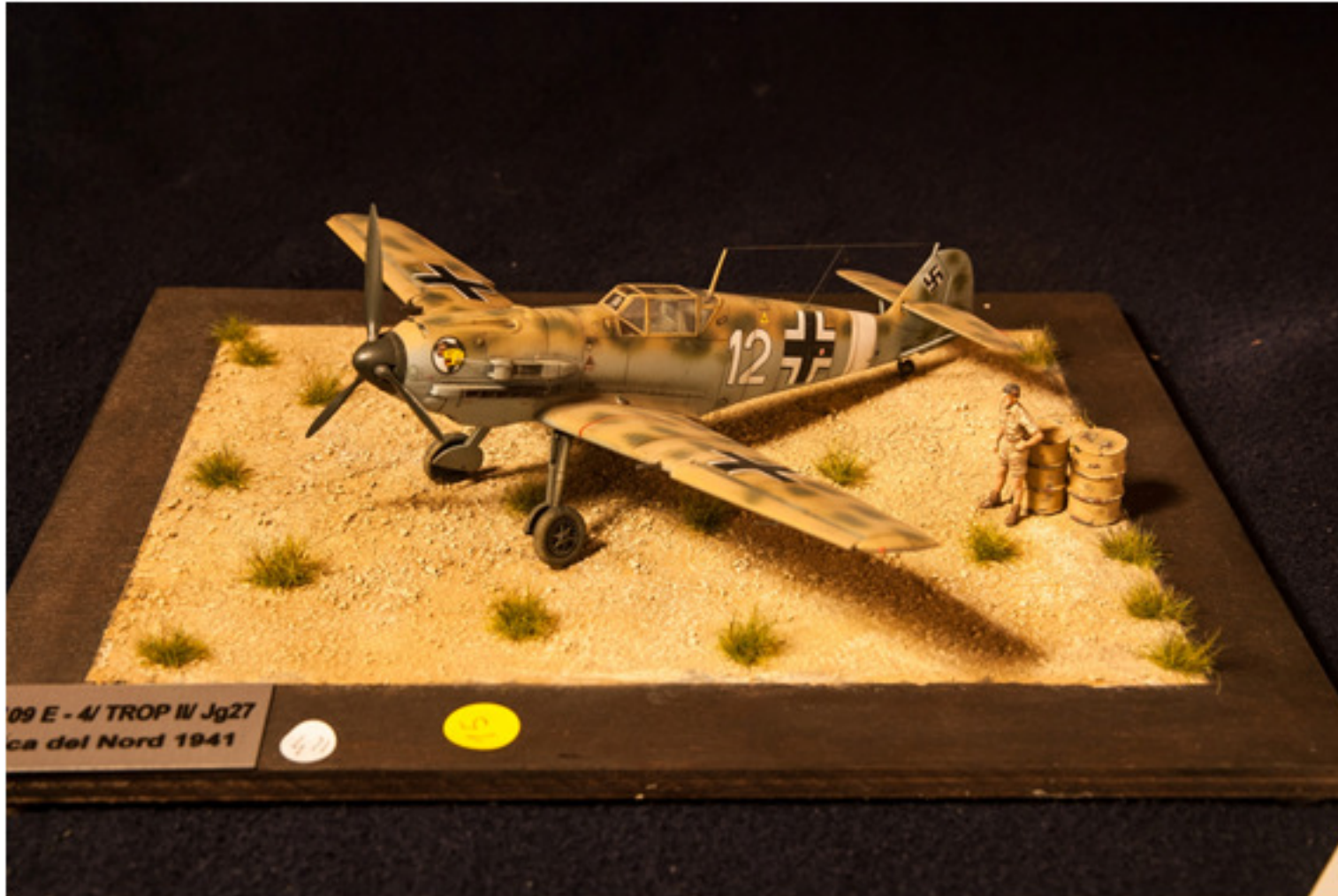
Diego Vicario : ME BF109 trop